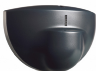
BEA Radar Eagle One

Détecteur d'ouverture pour portes automatiques