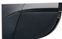
BEA Détecteur Flatscan SW

Détecteur d'ouverture pour portes automatiques