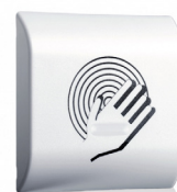
BEA Interrupteur Magic Switch

Détecteur infrarouge de sécurisation pour portes battantes